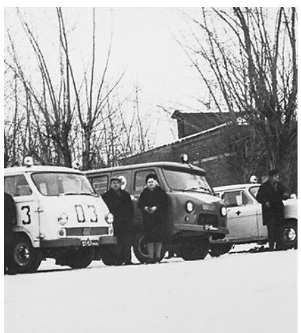
Транспорт Реутовской больницы в 1971 году

Физиотерапевтическая служба реутовской больницы формировалась