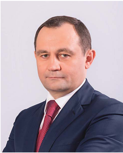
От всей души поздравляю жителей городского округа Реутов с Днём знаний!

Это прекрасный и волнительный праздник для каждого жителя. Он открывает дорогу в замечательный мир удивительных открытий и будущих свершений. Сегодня в образовательных учреждениях округа трудятся высокопрофессиональные, талантливые, ответственные и целеустремлённые люди. Они служат благородному делу воспитания молодого поколения в духе