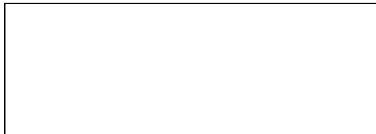
Схема границ эксплуатационной ответственности сторон

Прочие сведения по установлению границ раздела эксплуатационной ответственности сторон _____